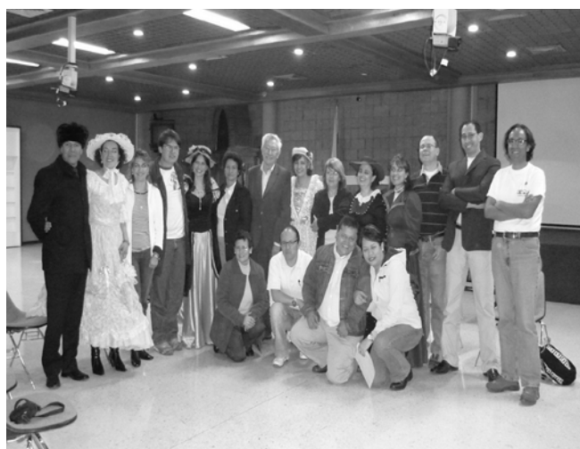
Fotografía de la representación teatral de la obra La muerte de Ivan Illich , 2008 (2).