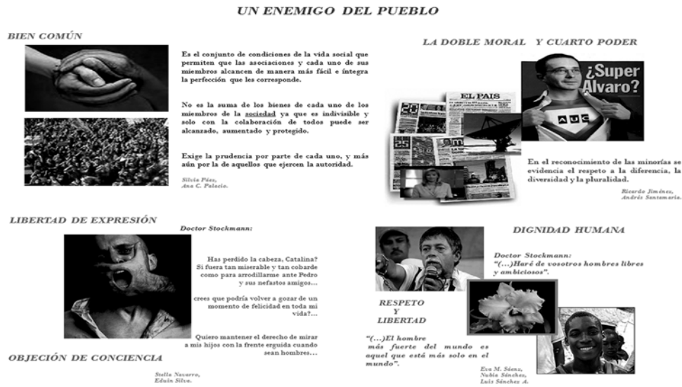
Poster de la exposición de la obra Un enemigo del pueblo , 2008 (1).