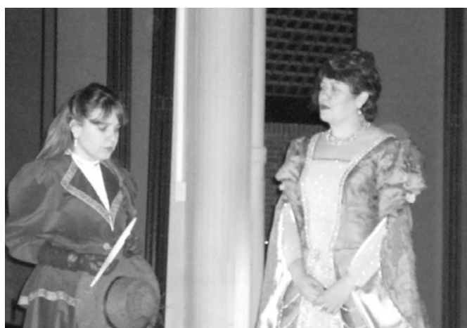
Fotografía de la representación teatral de la obra La muerte de Iván Illich (2008-2)